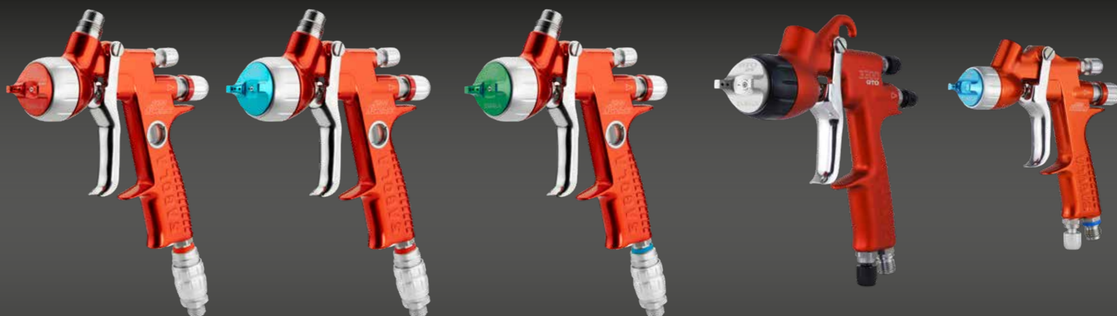
4600 Xtreme HS